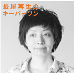
長屋再生の キーパーソン

生野で動き出している取組みをご紹介しつつ、さまざまなアイデアを プロフェッショナルたちが持ち寄り、生野の未来について考えます。