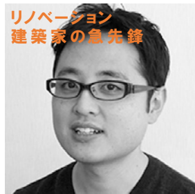
リノベーション 建築家の急先鋒