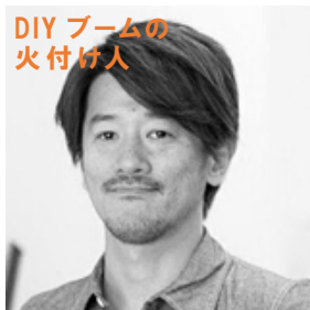
DIYブームの 火付け人