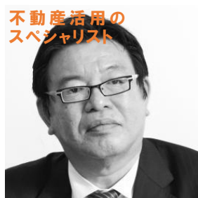
不動産活用の スペシャリスト