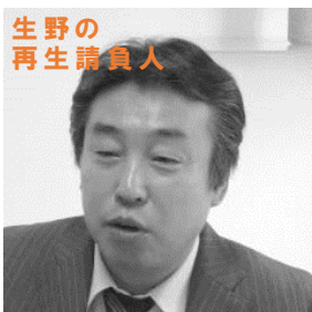
生野の 再生請負人